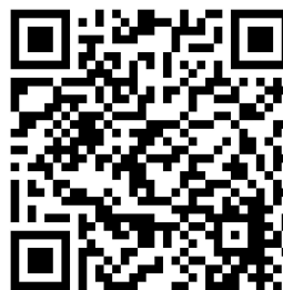
Tarjeta de Acceso de Idioma